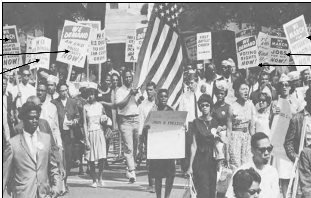
[Uit The Day They Marched deur DE Saunders]

Die foto hieronder is uit 'n boek met die titel The Day They Marched , deur DE Saunders. Dit toon burgerregte-optogangers met plakkate gedurende die Opmars na Washington op 28 Augustus 1963.