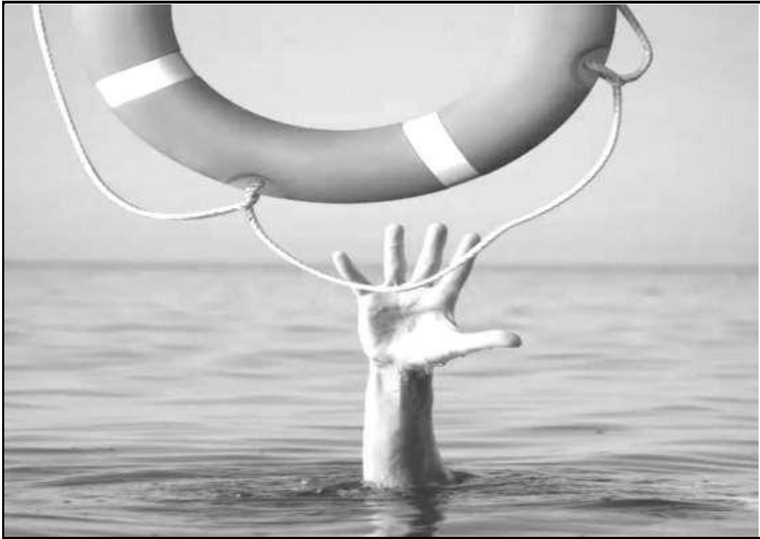
[Se qotsitswe le ho lokiswa ho tswa ho www.black and white pictures ]