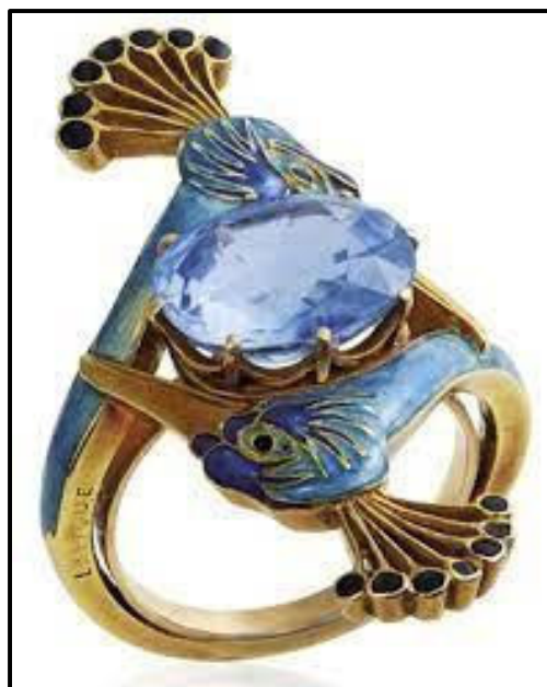
FIGUUR I: Art Nouveau-ring deur René Lalique (Frankryk), circa 1900.

Skryf 'n opstel (ten minste EEN bladsy) waarin jy die ringe in FIGUUR H en FIGUUR I hierbo vergelyk en verduidelik hoe hulle tipies is van die bewegings wat hulle verteenwoordig.