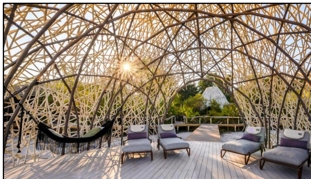
FIGUUR K: Voëlnes ('Bird's Nest')-swembadtuinhuisie ('n buitelug-struktuur wat skadu teen die son verskaf en vir buitelugonthaal gebruik kan word), Jao Kamp Okavango Delta-lodge (Botswana), 2022.