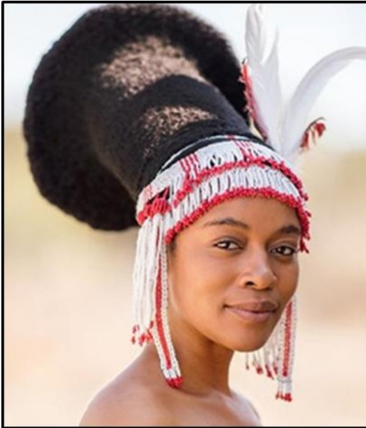
FIGUUR D: Tradisionele amaZulu-haarstyl (Suid-Afrika), 2022.