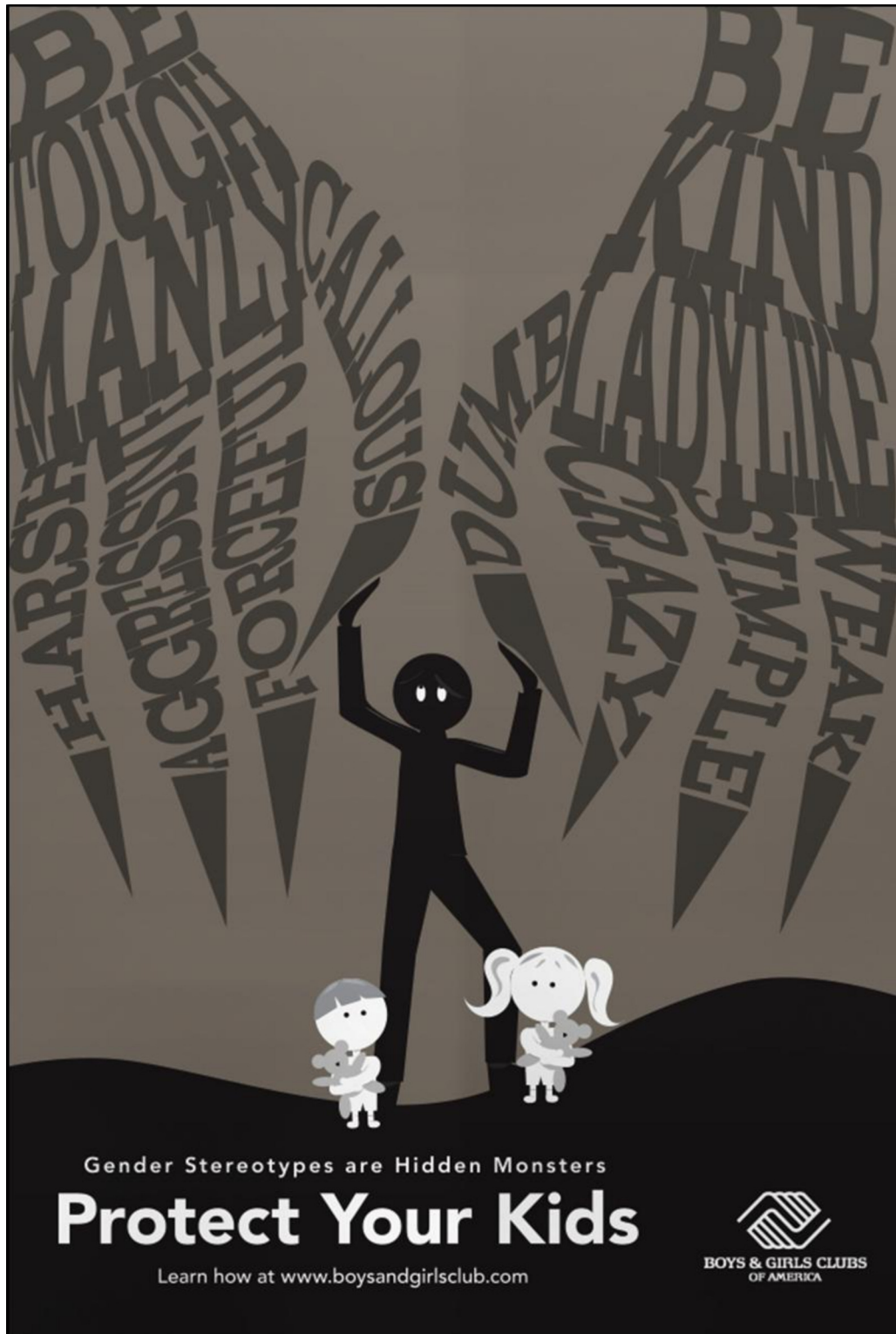
FIGUUR C: Geslagstereotipe-veldtogplakkaat deur Lindsay Helms (VSA), 2017.

Verduidelik hoe beelde en teks gebruik word om die boodskap van geslagstereotipering in FIGUUR C hierbo oor te dra.