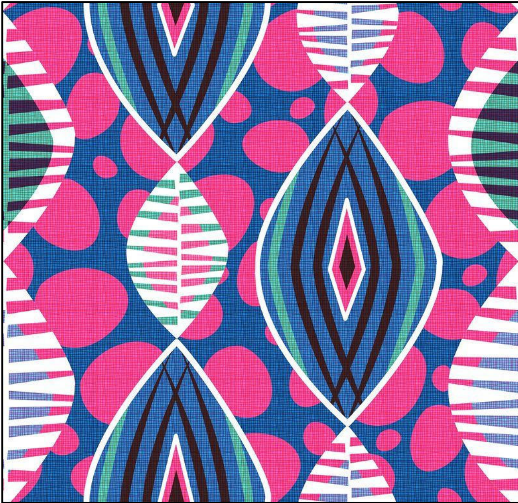
FIGUUR A: Tekstielontwerp ter ere van Swart Geskiedenis-maand ('Black History Month') deur Spoonflower (VSA), 2020.

1.1.1 Analiseer die gebruik van die volgende elemente en beginsel in FIGUUR A hierbo: