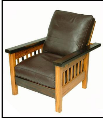
Kuns en Kunsvlyt