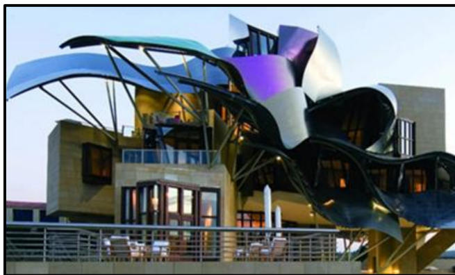
FIGUUR G: Marqués de Riscal Hotel- en Wynkelder-kompleks deur Frank Gehry (Spanje), 2006.