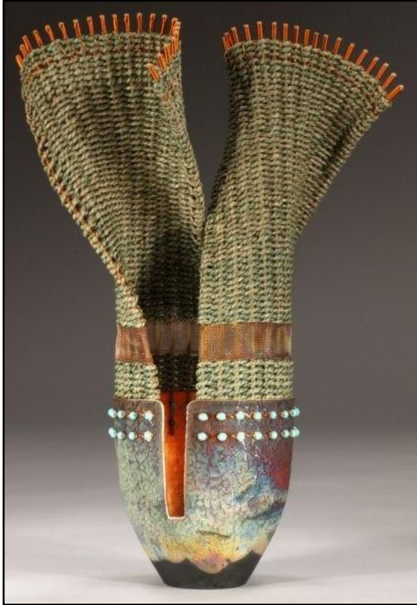
FIGUUR B: Raku-gebakte keramiek- en mandjiewerk-houer deur Willow Bend Studio-ontwerpers Marc Jenesel en Karen Pierce (VSA), 2018.

1.2.1 Analiseer die ontwerp in FIGUUR B hierbo deur na die volgende te verwys: