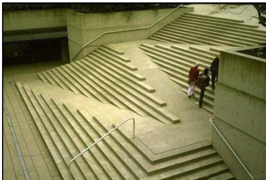
FIGUUR J: Rockson Square-trap deur Arthur Erickson Architects (Kanada), 1983.