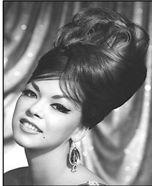
FIGUUR E: Modieuse byekorphaarstyl (VSA), 1960's.

Skryf 'n paragraaf waarin jy die haarstylontwerpe in FIGUUR D en FIGUUR E vergelyk met verwysing na die volgende: