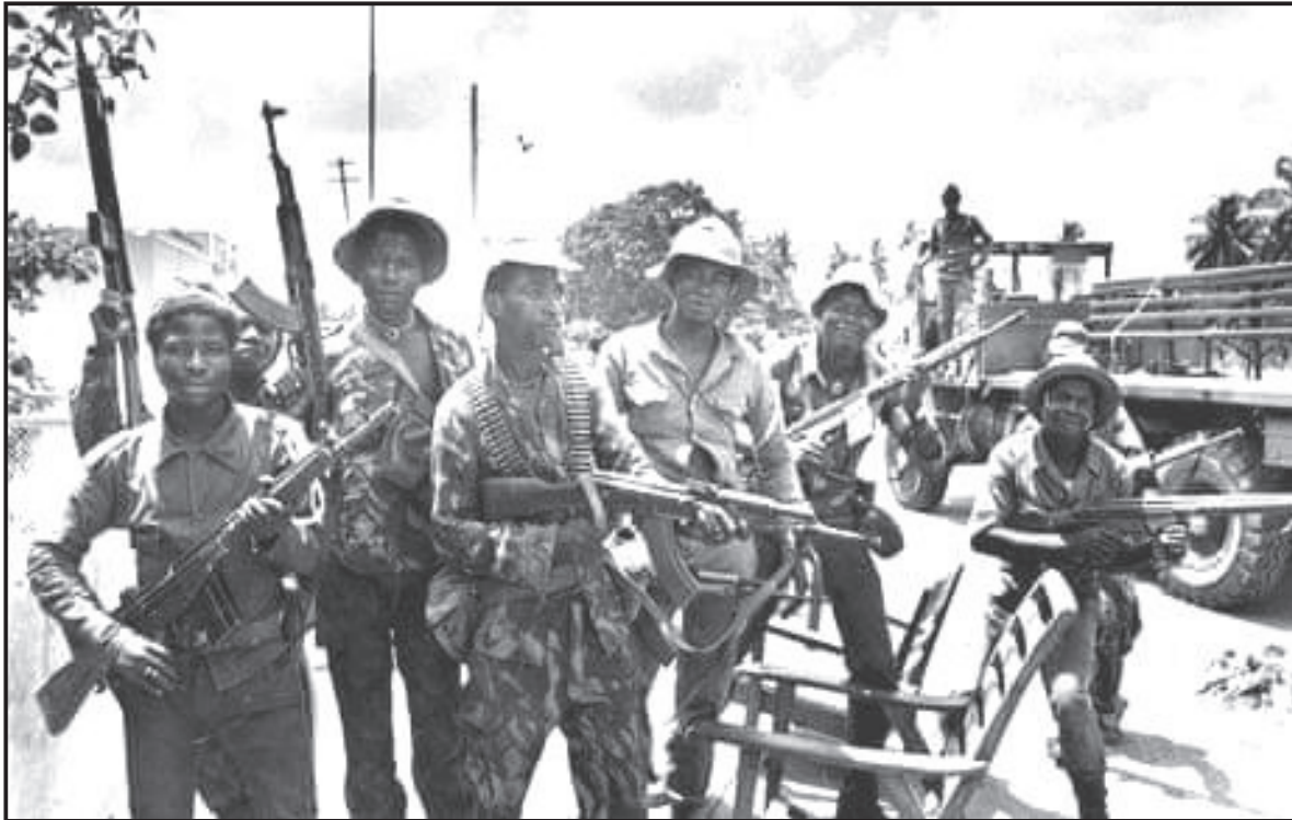
[Uit die Guardian -koerant, 5 Mei 2014]

Die foto hieronder met die titel 'Angola's Brutal History and the MPLA's Role in it', het in die Guardian -koerant van 5 Mei 2014 verskyn. Dit is in Desember 1975 geneem en beeld soldate van die 'Popular Movement for the Liberation of Angola' (MPLA) uit wat in die Angolese Burgeroorlog geveg het.