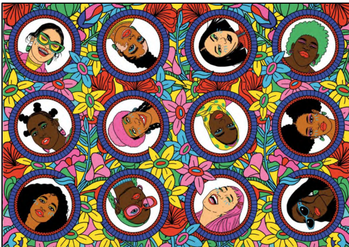
FIGUUR A: Oppervlakontwerp deur Zinhle Sithebe (Suid-Afrika), 2020.

1.1.1 Analiseer die gebruik van die volgende elemente en beginsels in FIGUUR A hierbo: