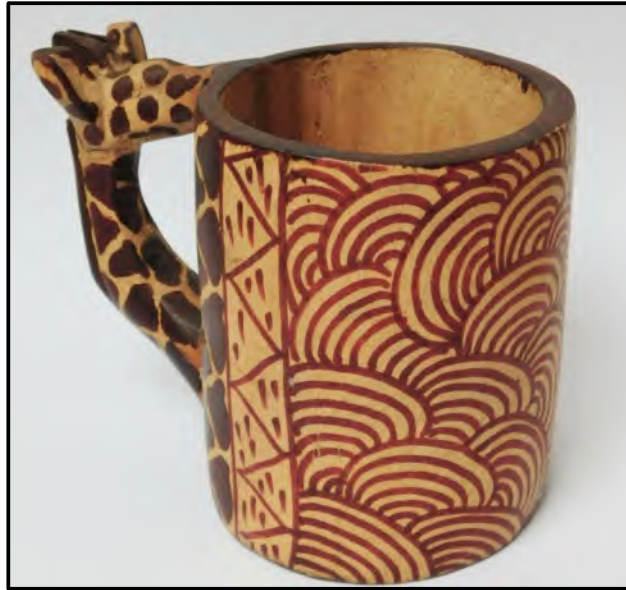
FIGUUR D: Hout-kameelperdbeker ('Wooden Giraffe mug') , ontwerper onbekend (Kenia), 2015.