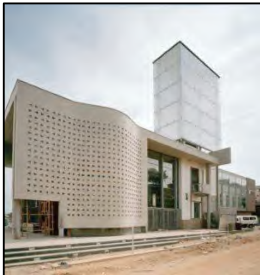
FIGUUR G: Die Konstitusionele Hof deur Urban Solutions and OMM Design Workshop (Suid-Afrika), 1996.