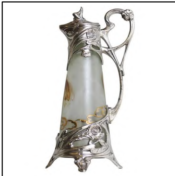
FIGUUR H: Art Nouveau-kraffie deur J Barian (Frankryk), 1900's.