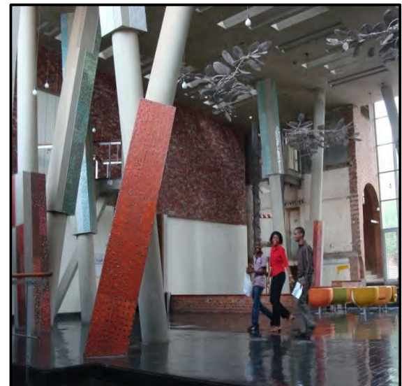
Gedeelte van die interieur van die Konstitusionele Hof .

Skryf 'n opstel (ten minste EEN bladsy) waarin jy die Amerikaanse Kongresgebou in FIGUUR F met die Suid-Afrikaanse Konstitusionele Hofgebou in FIGUUR G vergelyk.