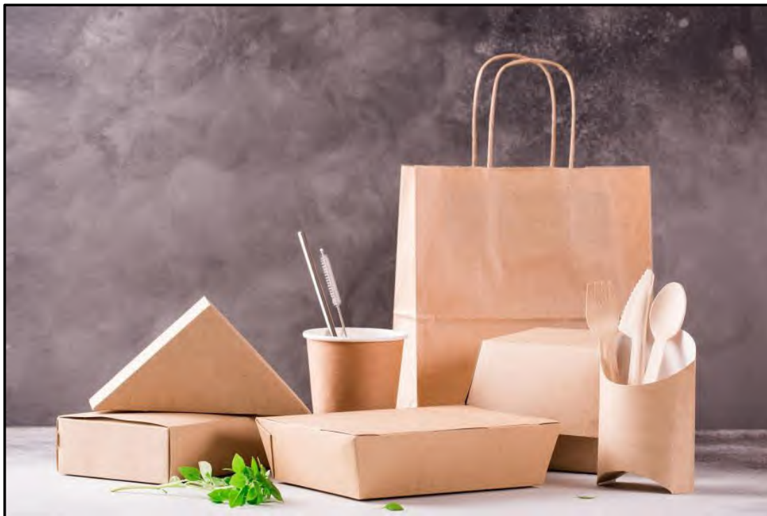
FIGUUR K: Ekovriendelike verpakking deur Viro Solutions (Suid-Afrika), 2019.

6.1.1 Bespreek waarom die verpakking in FIGUUR K ekovriendelik is. (2)