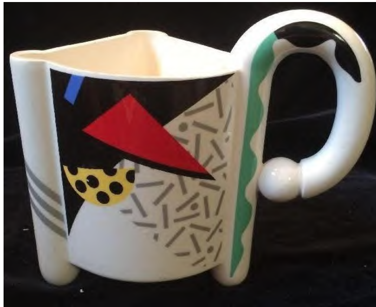
FIGUUR E: Karnaval-beker ('Carnival mug') deur Fujimori vir Kato Kogei Ceramics (Japan), 1980's.

Skryf 'n paragraaf waarin jy die beker in FIGUUR D met die beker in FIGUUR E vergelyk.