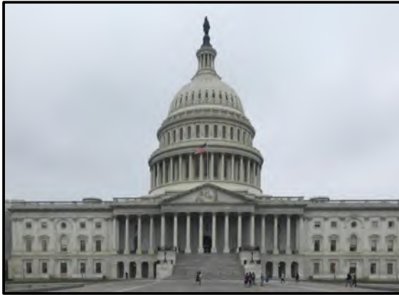
FIGUUR F: Die Amerikaanse Kongresgebou deur William Thornton (VSA), 1793–1826.