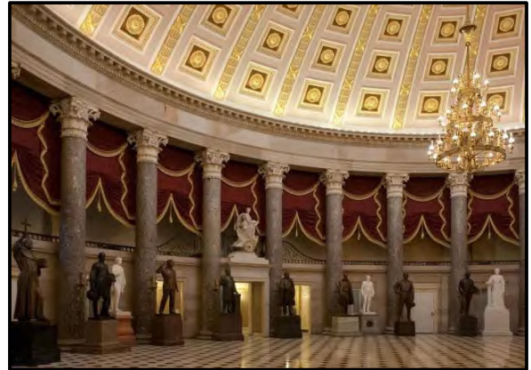
Besonderhede van die interieur van die Amerikaanse Kongresgebou .