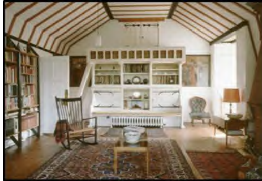
Kuns en Kunsvlyt