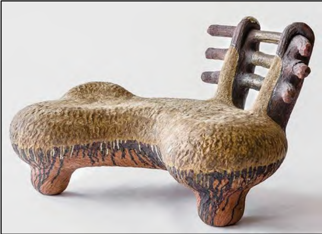
FIGUUR B: uBuhlanti (Kraal)-bank deur Andile Dyalvane (Suid-Afrika), 2020.

Analiseer die gebruik van die volgende terme ten opsigte van hulle gebruik in FIGUUR B hierbo: