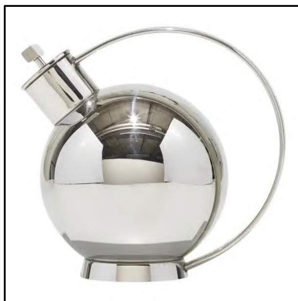
FIGUUR I: Bauhaus-mengfles deur Marianne Brandt (Duitsland), 1925.

Skryf 'n opstel (ten minste EEN bladsy) waarin jy die TWEE bekere hierbo vergelyk en verduidelik hoe hulle tipies is van die ontwerpbewegings wat hulle verteenwoordig.