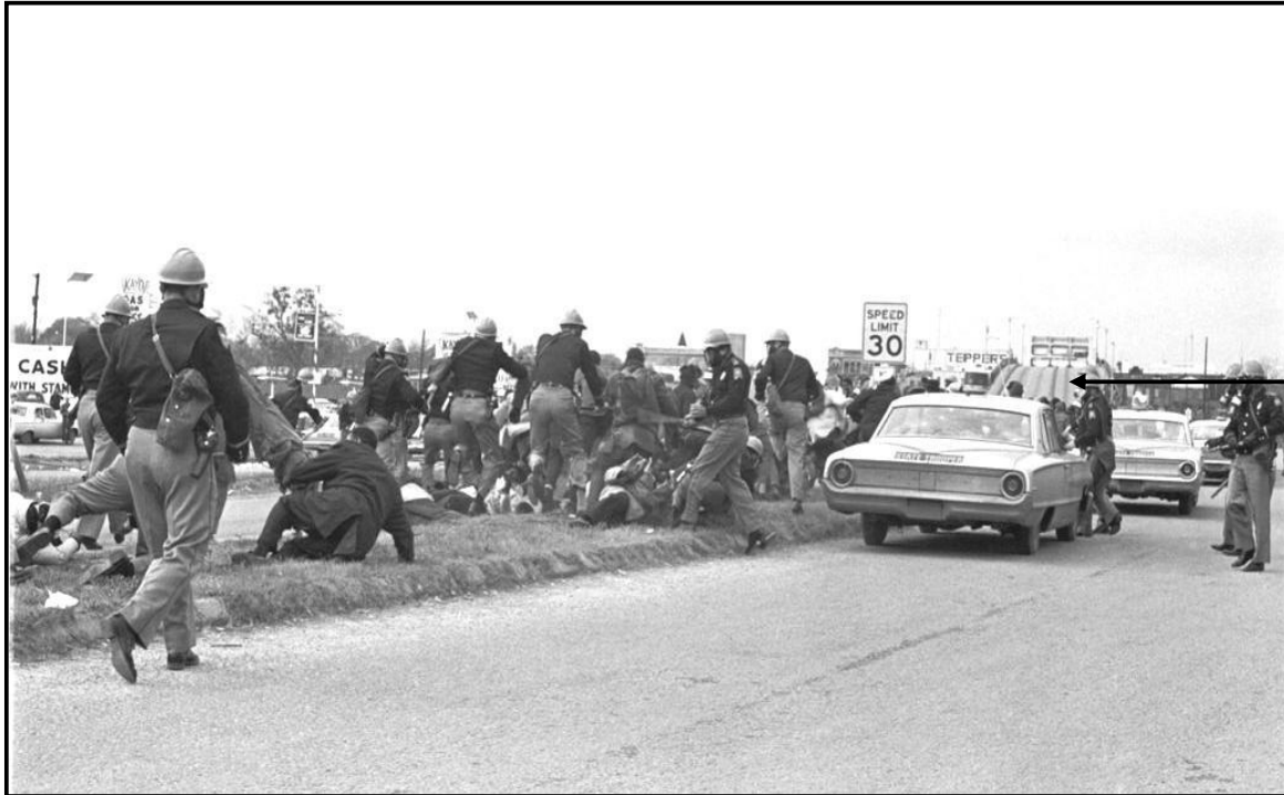
[Uit The Light of Ours – Activist Photographs of the Civil Rights Movement deur L Kelea]

Die foto hieronder toon die Burgerregtebeweging se aktiviste wat op 7 Maart 1965, gedurende die eerste optog van Selma na Montgomery, deur die Staatspolisiebeamptes aangeval word nadat hulle die Edmund Pettus-brug oorgesteek het.