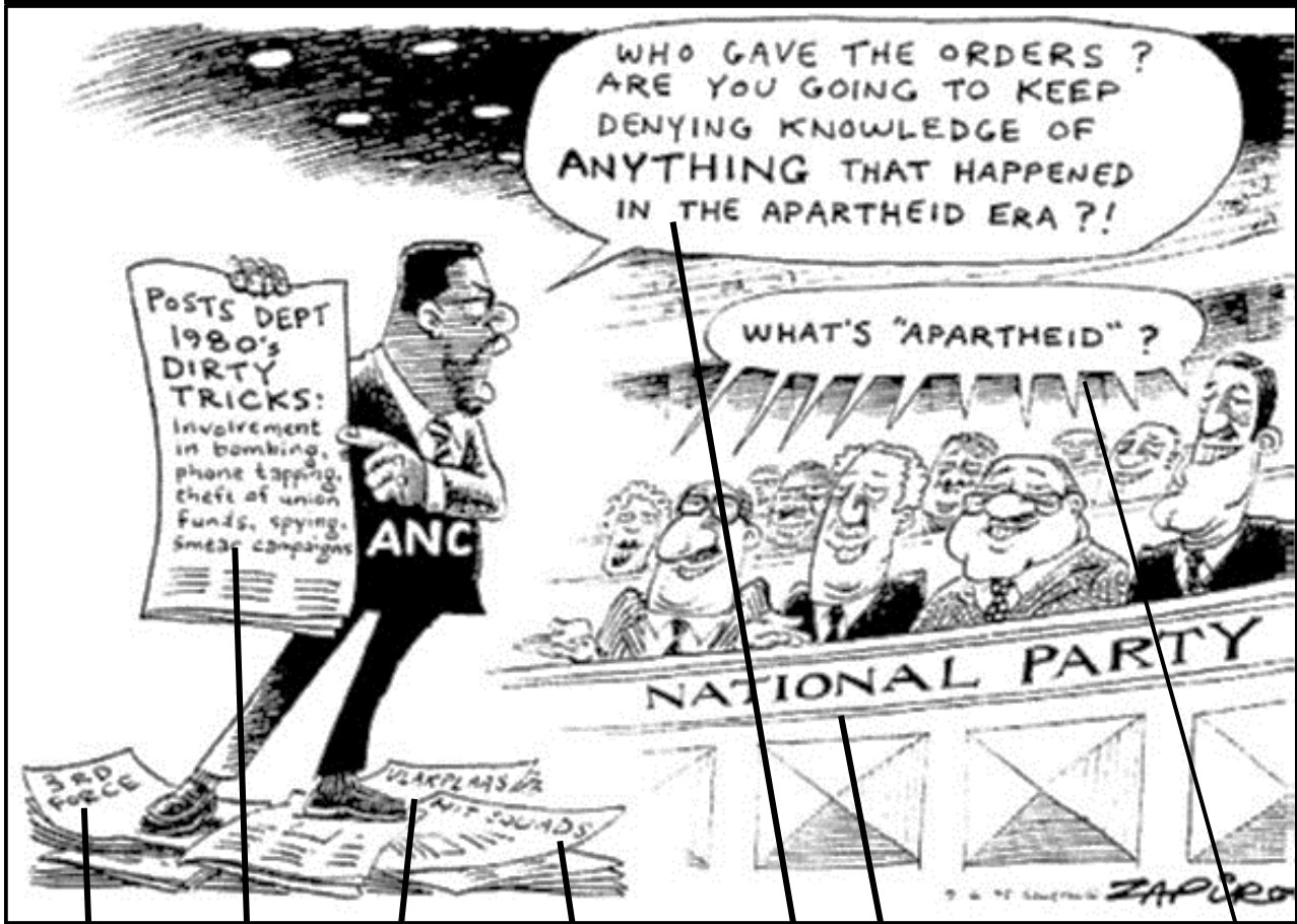
[Uit Sowetan, 9 Junie 1995]

*Zapiro – 'n Welbekende Suid-Afrikaanse spotprentjie-tekenaar