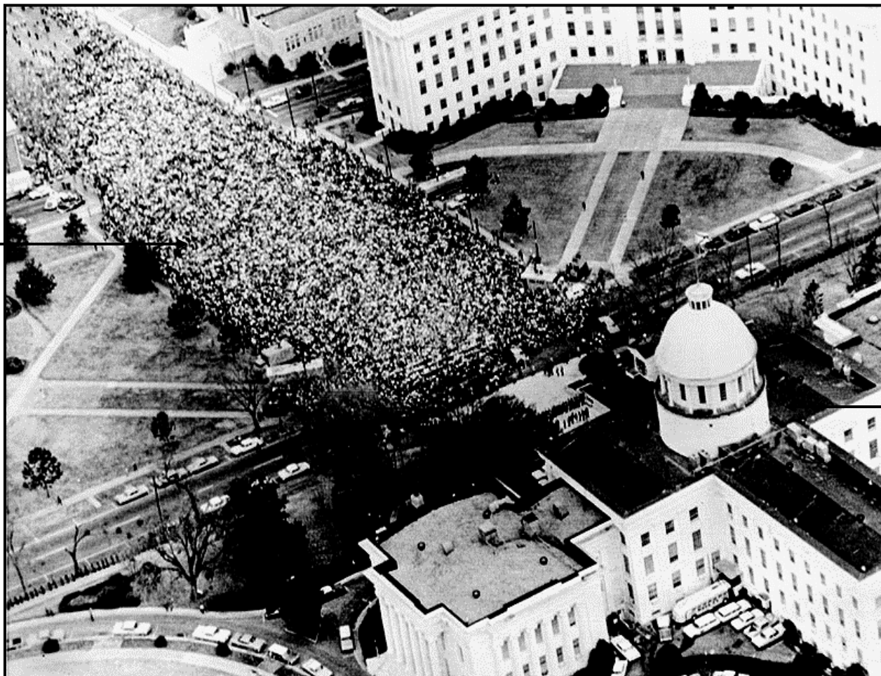
[Uit The Civil Rights Movement: A Photographic History deur S Kasher]

Dit is 'n lugfoto wat op 25 Maart 1965 by Dexter Avenue voor die Alabama-staatskongresgebou in Montgomery geneem is. Dit toon sowat 25 000 betogers wat daarin geslaag het om met hulle derde poging ná hulle Selma op 21 Maart 1965 verlaat het, in Montgomery aan te kom.