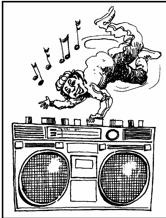
[Uit: Art Explosion]