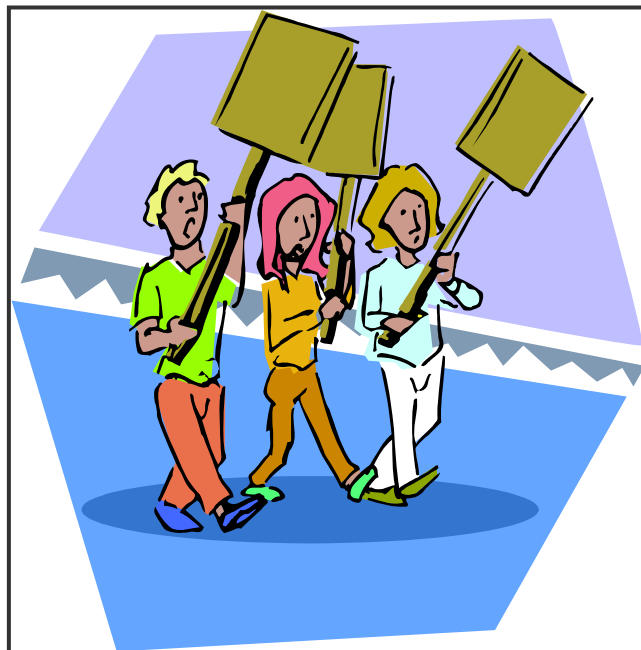
[Uit: Art Explosion]