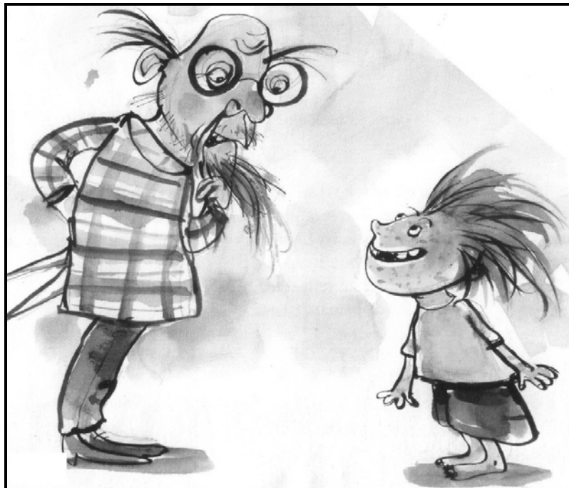
[Bron: Taalgenoot , Junie 2009]