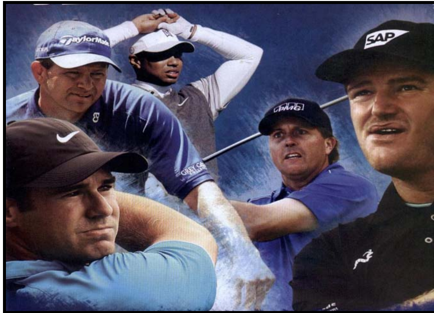
[Uit: DSTV-gids, Mei 2008]