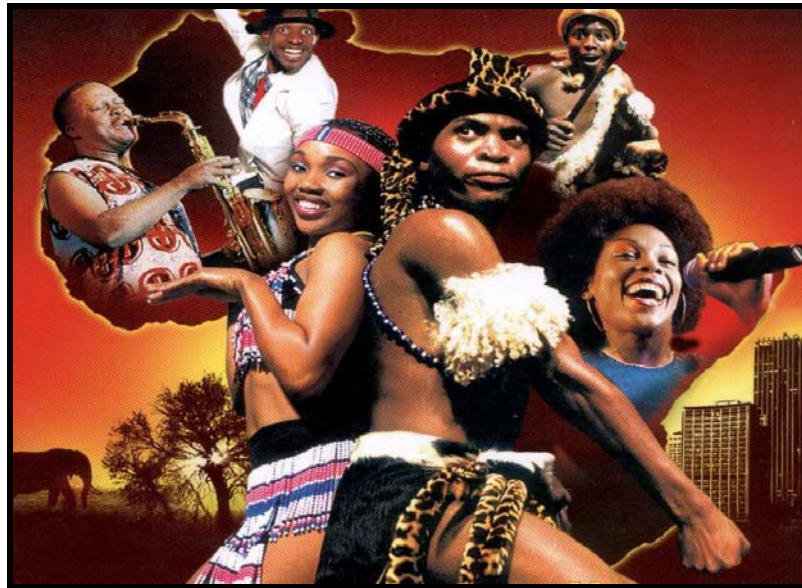
[Uit: Gauteng , Desember 2007]