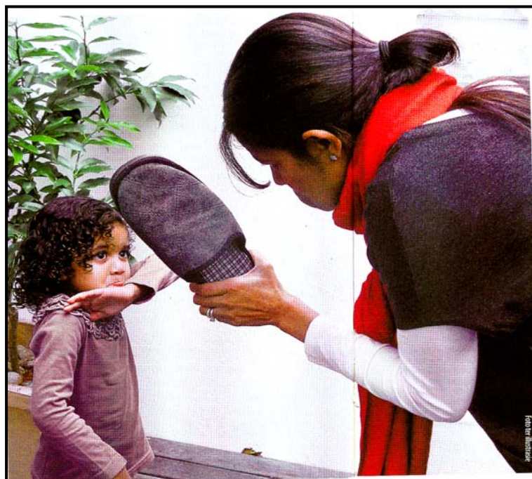
[Uit Kuier , 25 Mei 2011]