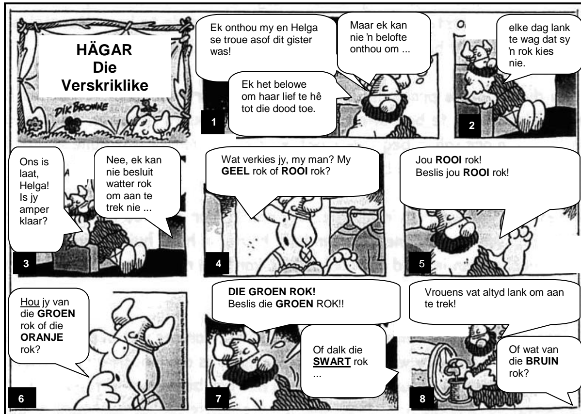
[Uit: Beeld , Maart 2010]

Die taalvrae wat volg, is op die strokiesprent hieronder gebaseer.