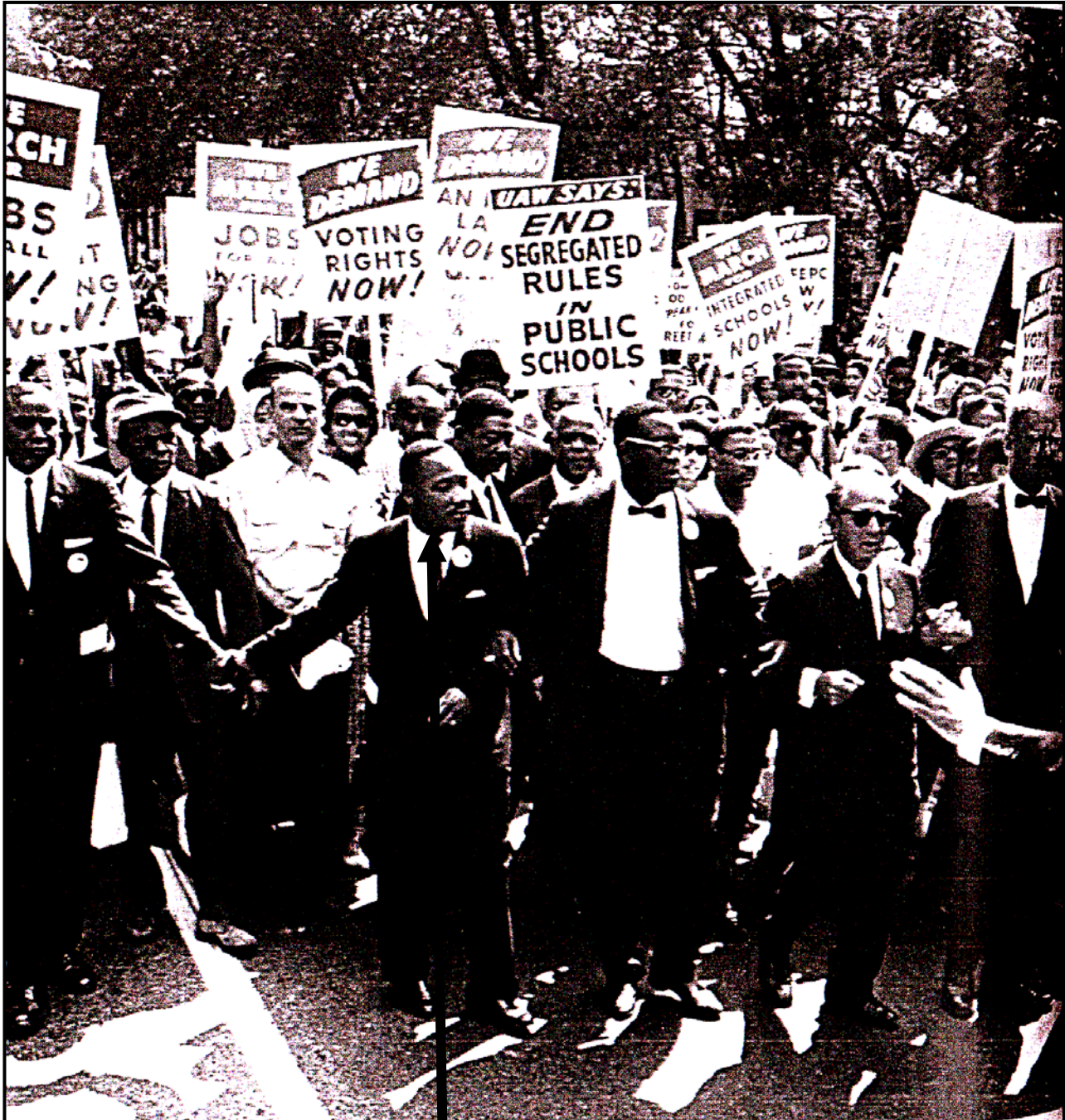
Martin Luther King Jr.