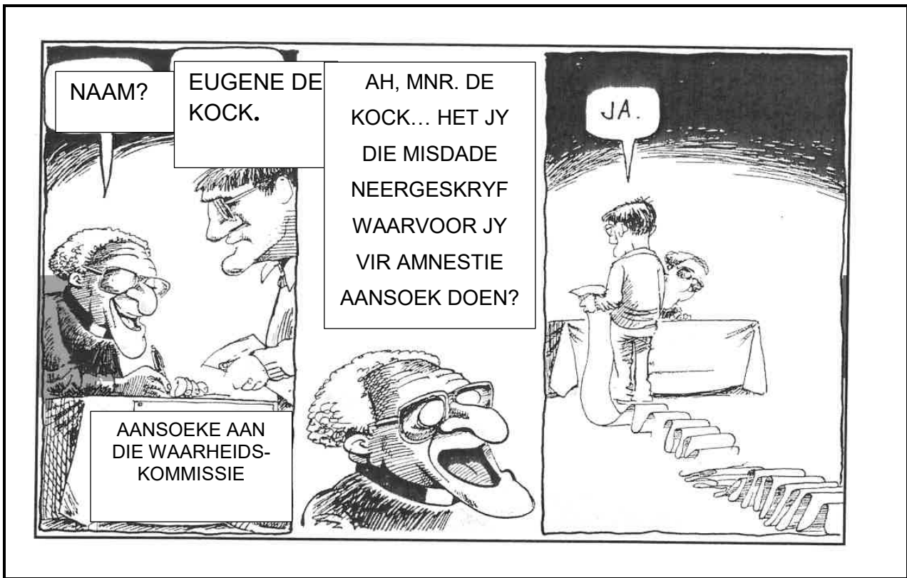
[Uit http://www.saha.org.za/news/2013/July/gallery_eugene_de_kock.ht Toegang op 21 Oktober 2019 verkry.]

Die spotprent deur Zapiro hieronder beeld Aartsbiskop Desmond Tutu uit waar hy Eugene de Kock se aansoek om amnestie ontvang.