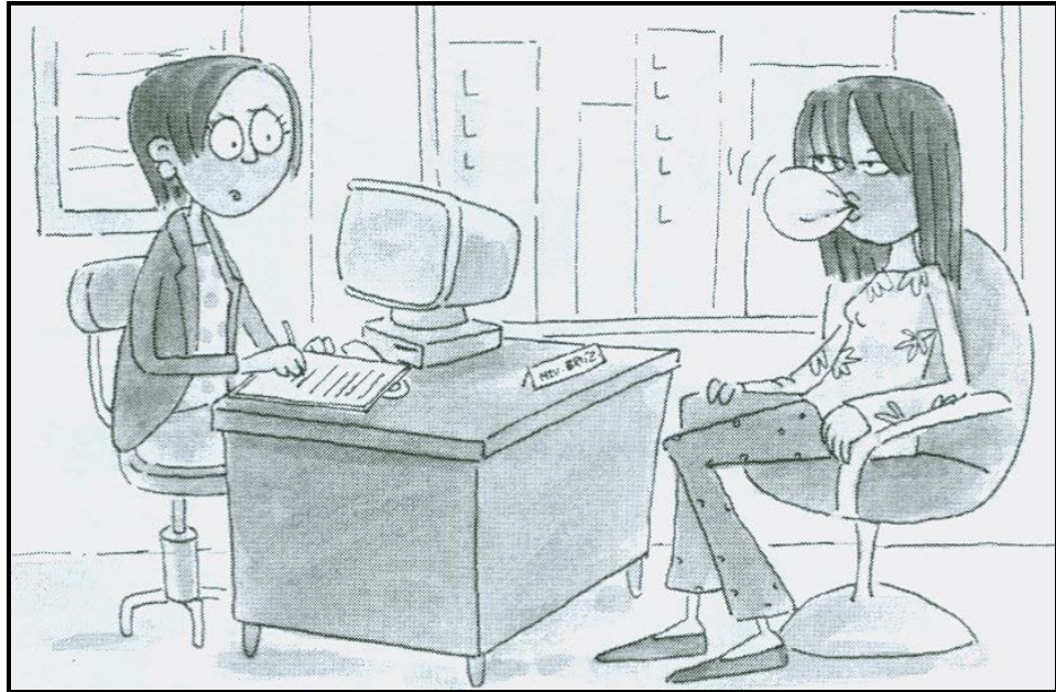
[Uit: Shuters Life Orientation, Gr. 9 ]